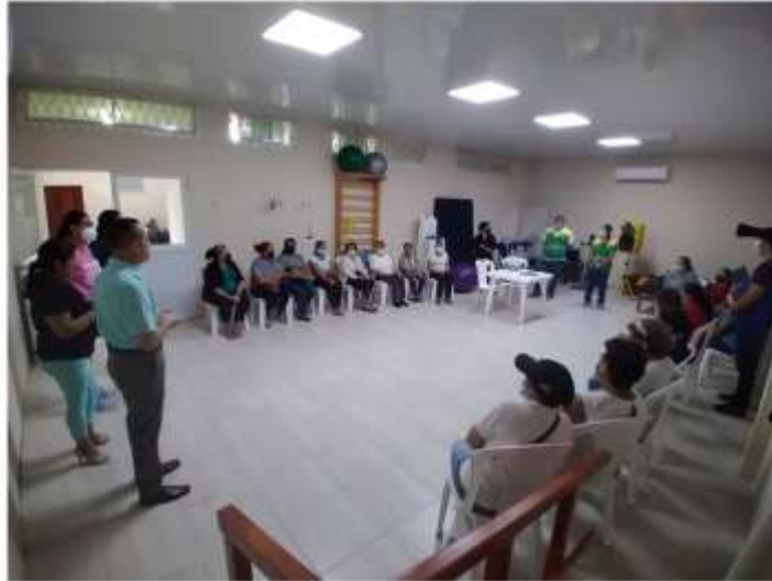
RENDICIÓN DE CUENTAS AÑO 2022