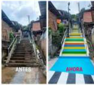
SAN JOSÉ 1