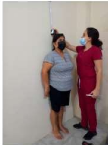
RENDICIÓN DE CUENTAS AÑO 2022